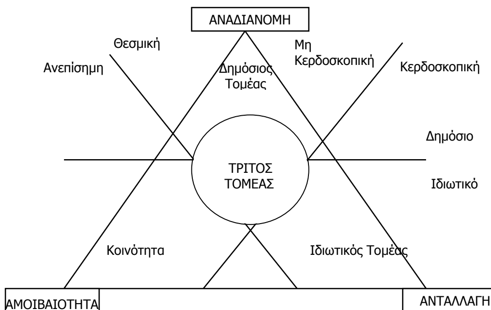
Διάγραμμα 1: Η θέση του τρίτου τομέα στο σύγχρονο κόσμο

υποτάσσονται. Αυτός ο υπερκαθορισμός κάθε τομέα από μία αρχή διαχέεται στο σύνολο της σύγχρονης καπιταλιστικής οικονομίας, όπου οι μη αγοραίες και μη χρηματικές οικονομίες υποτάσσονται στην αγοραία. Το μη αγοραίο είναι συμπληρωματικό και το μη χρηματικό υπολειμματικό. Ο τρίτος τομέας θεωρητικοποιείται ως ένας πόλος που αποτελεί ένα υβριδικό μόρφωμα και βρίσκεται στο επίκεντρο της διάδρασης ανάμεσα στην αγοραία, στη μη αγοραία και στη μη χρηματική οικονομία.